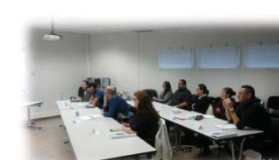
CLUB DES CRÉATEURS PÔLE EMPLOI DE LAVALUR (81)