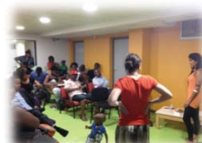
RENCONTRE AVEC LA COMMUNAUTÉ GUINEENNE (TOULOUSE)