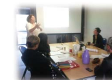
Campagne « Ya pas d'âge pour créer sa boîte » (Toulouse)