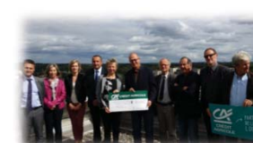
CONVENTION AVEC LE CRÉDIT AGRICOLE NORD MIDI-PYRÉNÉES