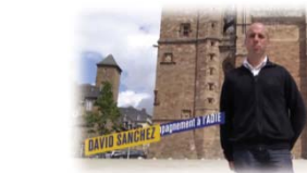
FRANCE 3 - LES DOSSARDS DE L'EMPLOI (RODEZ)