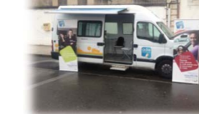
PERMANENCES MOBILES SUR LES MARCHÉS ET DANS LES QUARTIERS