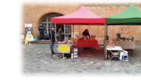
SEMAINE DU MICROCRÉDIT (MONTAUBAN)