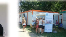
RASSEMBLEMENT DE VOYAGEURS À LOURDES (65)