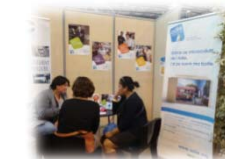
FORUM ENTREPRENEUR AU FEMININ (MONTAUBAN)