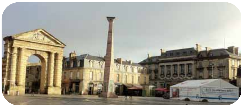
10ème Semaine du microcrédit, Place de Victoire à Bordeaux