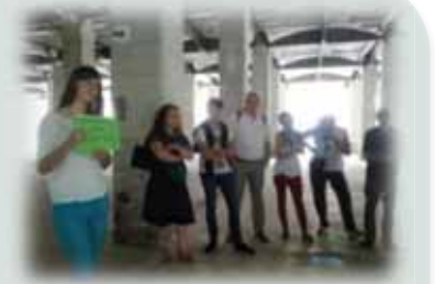
Visite chez Darwin éco-système

Sur l'initiative de Thierry Marx et en partenariat avec Les Apprentis d'Auteuil, le Lycée hôtelier Saint Michel et le CCAS de Blanquefort, l'Adie forme des chômeurs sur des métiers de la restauration rapide de qualité. En 2014, 21 stagiaires ont suivi cette formation sur ce métier en tension.